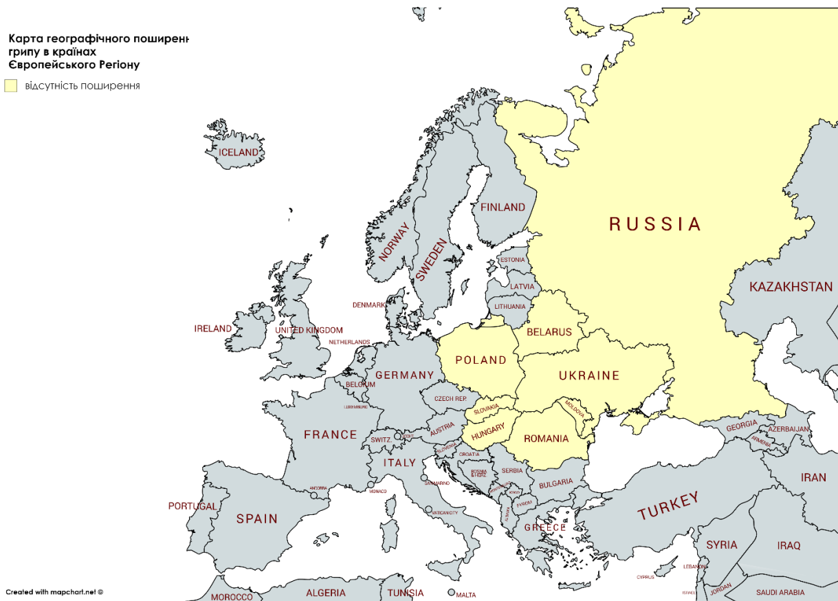
Мал. 1. Адаптовано на основі карти географічного поширення грипу в країнах Європейського Регіону ( http://flunewseurope.org ) за 40 тиждень 2018 року

За даними спільного бюлетеню ВООЗ та Європейського Центру по контролю за хворобами ( http://flunewseurope.org ) в усіх країнах, що межують з Україною, спостерігається низька інтенсивність активності грипу та відсутність географічного поширення грипу (малюнок 1).