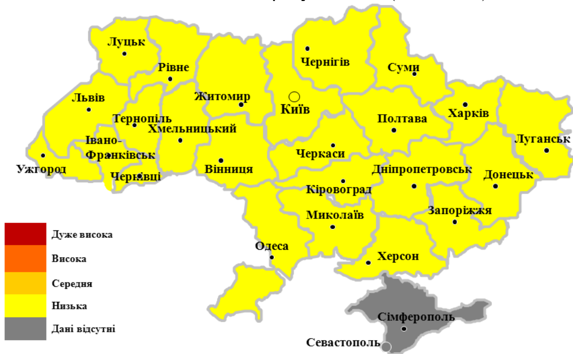
Мал.3. Інтенсивність активності грипу та ГРВІ в Україні, 41/2018

В Україні спостерігається відсутність географічного поширення та низька інтенсивність епідемічної активності грипу та ГРВІ. (малюнок 3).